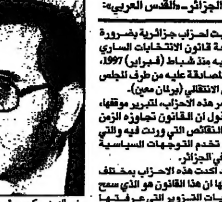
الجزائر - الفلبس العربية

الجزائر - الفلبس العربية - بدأت 45 ألفا من عمال البريد في الجزائر اضرابا احتجاجا على نتائج الانتخابات التشريعية التي جرت في 1997. وقد عادت صحيفة «الجزائر» التي تأسست عام 1977 بعد ان كانت قد توقفت عن الصدور في عام 1992.